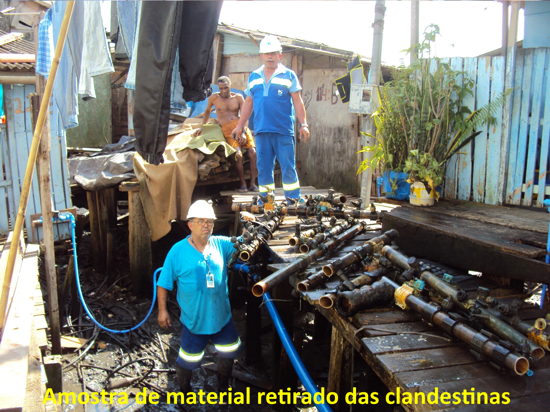
Amostra de material retirado das clandestinas