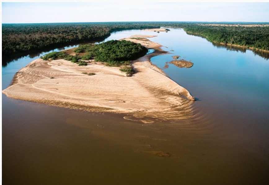
Região Hidrográfica Tocantins-Araguaia / Rio Araguaia

+ o Saneamento : “Art. 4º-A. A ANA instituirá normas de referência para a regulação dos serviços públicos de saneamento básico por seus titulares e suas entidades reguladoras e fiscalizadoras, observadas as diretrizes para a função de regulação estabelecidas na Lei nº 11.445, de 5 de janeiro de 2007 ”.