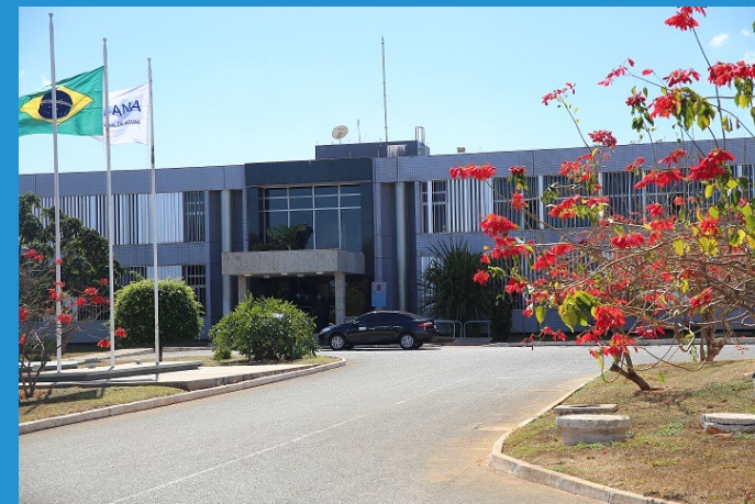
Edifício sede, em Brasília (DF)

(Redação dada pela Lei nº 14.026, de 2020)