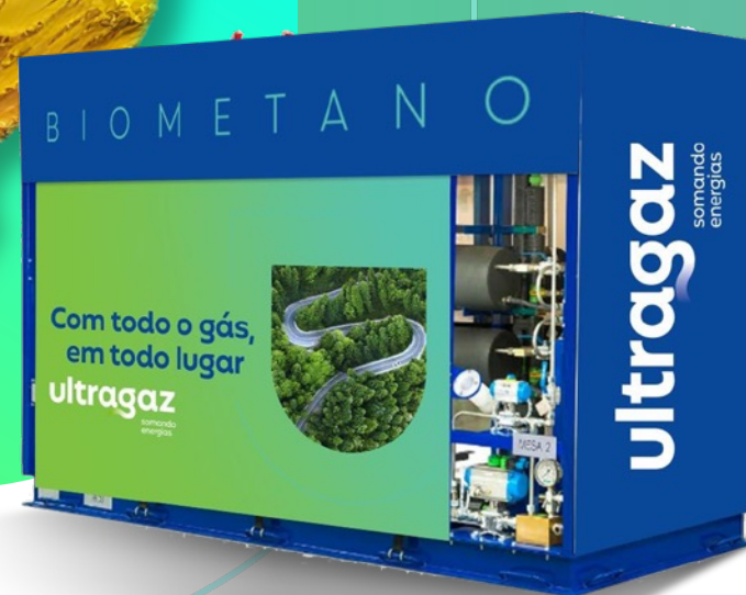
Unidade de descompressão